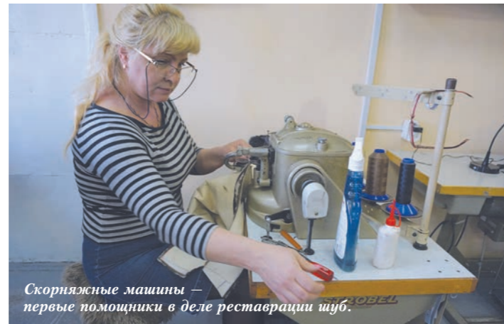
Скорняжные машины — первые помощники в деле реставрации шуб.

23 предприятия района отмечены дипломами в 25 номинациях городского конкурса на лучшее оформление к Новому году.