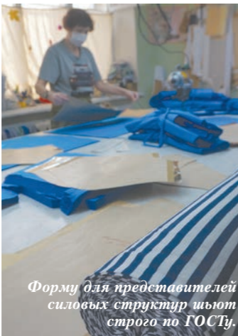
Форму для представителей силовых структур шьют строго по ГОСТу.

Е катеринбург — город больших возможностей, что особенно заметно по видам бытовых услуг, которые оказывают предприятия уральской столицы. Некоторые не найдешь не только в других городах Свердловской области, но и в соседних мегаполисах. Подводя итоги развития сферы бытового обслуживания Верх-Исетского района за 2018 год, мы решили рассказать о самых необычных и редких предложениях для потребителей.