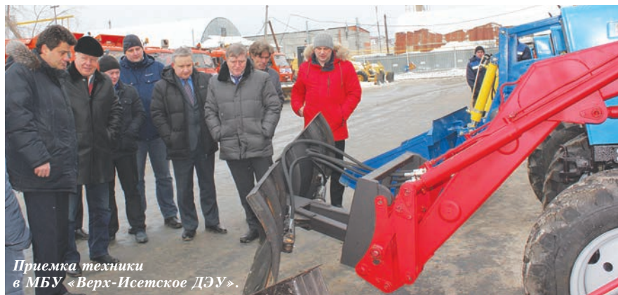
Приемка техники в МБУ «Верх-Исетское ДЭУ».

Давайте все вместе избавим район от снега, грязи и мусора, восстановим дорожки, покрасим малые архитектурные формы, уберем дикорос, который придает дворам неухоженность, продумаем работы по озеленению... Ведь город — наш общий «дом»!