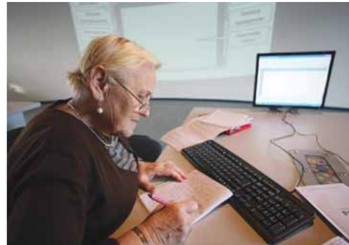
Подать заявление о назначении пенсии можно, не выходя из дома.

— Зависит от того, какое именно заявление. Всеобщая информатизация не обошла стороной и Пенсионный фонд. Например, с мая 2015 года у жителей Свердловской области появилась возможность подавать заявления о назначении пенсии и ее доставке через электронный сервис «Личный кабинет застрахованного лица».