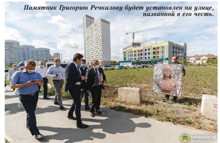
Памятник Григорию Речкалову будет установлен на улице, названной в его честь.

Современное оборудование позволит медикам анализировать и обрабатывать 200 тысяч исследований, проводить 15 тысяч телемедицинских консультаций и до 5 тысяч курсов дистанционного обучения для специалистов.