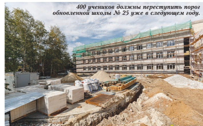
400 учеников должны переступить порог обновленной школы № 25 уже в следующем году.

В рамках строительства нового корпуса школы № 6 предполагается модернизировать стадион, расположенный перед входом в здание школы № 29 (улица Бебеля, 122 а), которая соседствует с «шестой». После усовершенствования стадион станет спортивным ядром