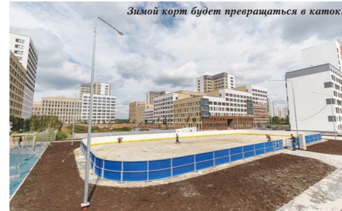
Зимой корт будет превращаться в каток.

дорожек идет, инженерные работы выполняются. Будем двигаться дальше!