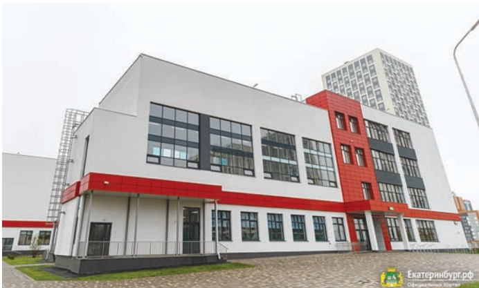
Школа № 79 имеет статус районного ресурсного центра по инженерно-технологическому образованию.

В от уже несколько лет в Верх-Исетском районе сохраняется замечательная традиция: начинать новый учебный год с открытия построенной с нуля или обновленной после масштабной реконструкции школы! Не стал исключением и этот год.