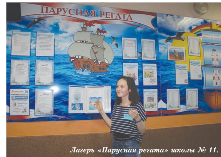
Лагерь «Парусная регата» школы № 11.

Тематика смен, как всегда, поражала разнообразием. Программы в лагерях при школах № 12, 23, 29, 57, 69 и 184 имели спортивно-оздоровительный профиль и были тесно связаны с проведением Чемпионата мира по футболу. Лагерь при образовательных учреждениях № 6, 9, 25, 29, 63 и 116 активно включились в подготовку к юбилею города: дети изучали историю Екатеринбурга, его достопримечательности и биографии известных горожан. Про-