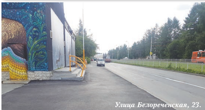
Улица Белореченская, 23.