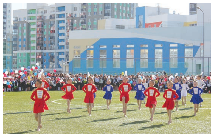
Выступление юных артистов на фоне второго здания школы № 23.

Кроме того, в районе — 4 стобалльника по русскому языку, информатике и физике из гимназий №№ 2, 9 и школы № 11.