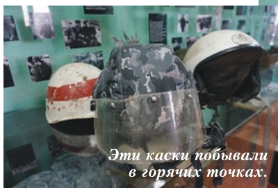
Эти каски побывали в горячих точках.