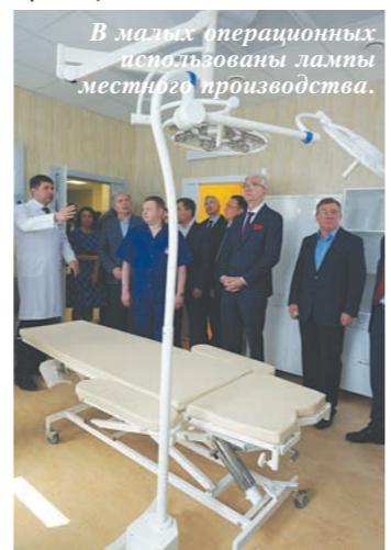
В малых операционных используются лампы местного производства.

— Но у нас, как в отделении реанимации, не может быть предела. Сколько к нам обратится, столько и примем, — подчеркнул главный врач ЦГБ № 2.