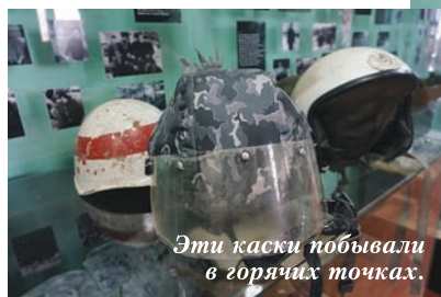
Эти каски побывали в горячих точках.