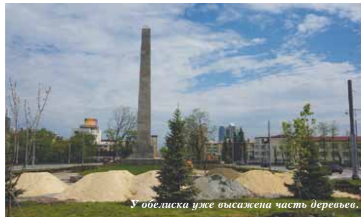
У обелиска уже высажена часть деревьев.

Остальные работы, согласно графику, должны быть также завершены в текущем году.