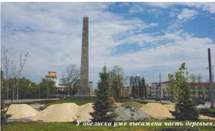
У обелиска уже высажена часть деревьев.

Остальные работы, согласно графику, должны быть также завершены в текущем году.