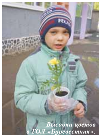
Высадка цветов в ГОЛ «Буревестник».

кварталы. В конце июня на карте ЭкоГрада не осталось свободного места. Что понималось под добрыми делами? Например, высадка цветов на пришкольной территории и установка табличек, призывающих не бросать мусор, не топтать газон, не забывать кормить птиц и т. п. Ребята сделали эти таблички своими руками.