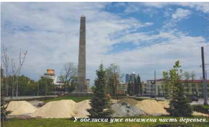
У обелиска уже высажена часть деревьев.

Остальные работы, согласно графику, должны быть также завершены в текущем году.