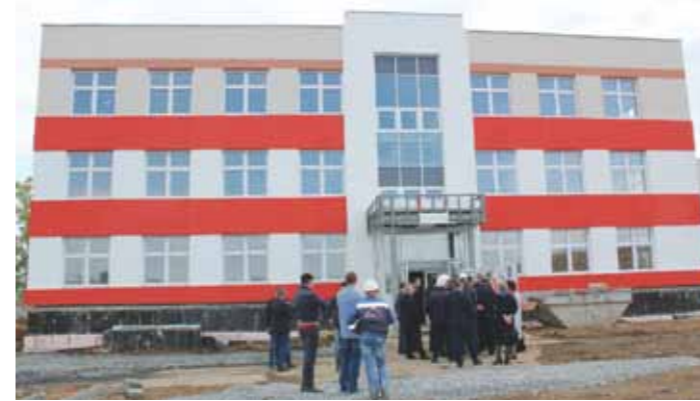
Уникальное учреждение примет детшек уже 1 сентября этого года.