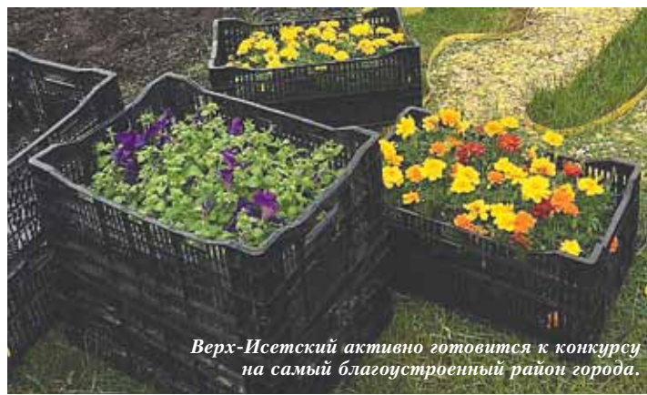
Верх-Исетский активно готовится к конкурсу на самый благоустроенный район города.

Абсолютно новый цветник появился у дома № 16 на улице Папанина. Здесь специалисты использовали сочетания древесных и цветочных культур.